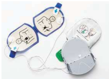
除細動パッドパック HDF-PD-3150